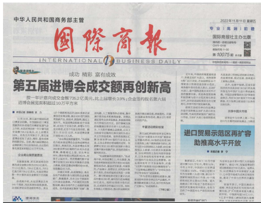
图 2-2 征求意见稿公示——报纸一次公示