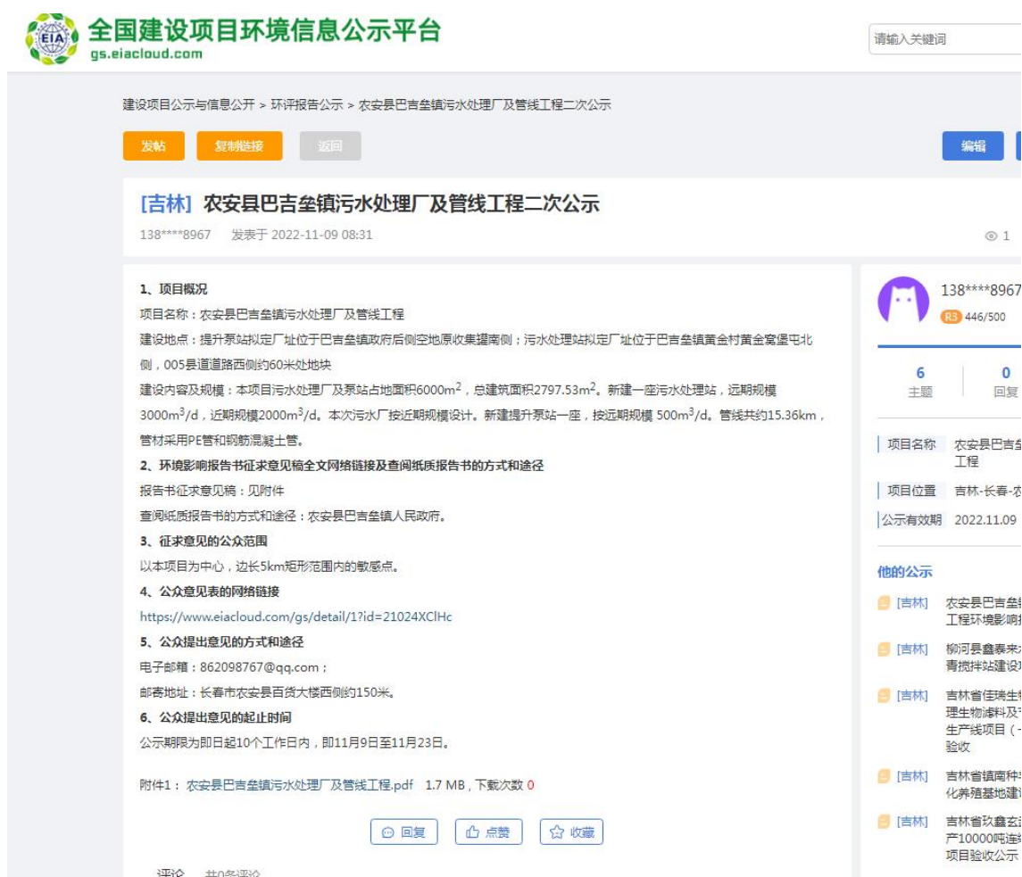
图 2-1 网络公示页面截图

本项目采取在环评互联网进行网络公示，载体选取符合《环境影响评价公众参与办法》（生态环境部令 第4号）中的相关要求。公示网址为 https://www.eiacloud.com/gs/detail/1?id=21109fvkr3 ，公示日期为2022年11月9日-11月22日（10个工作日）。