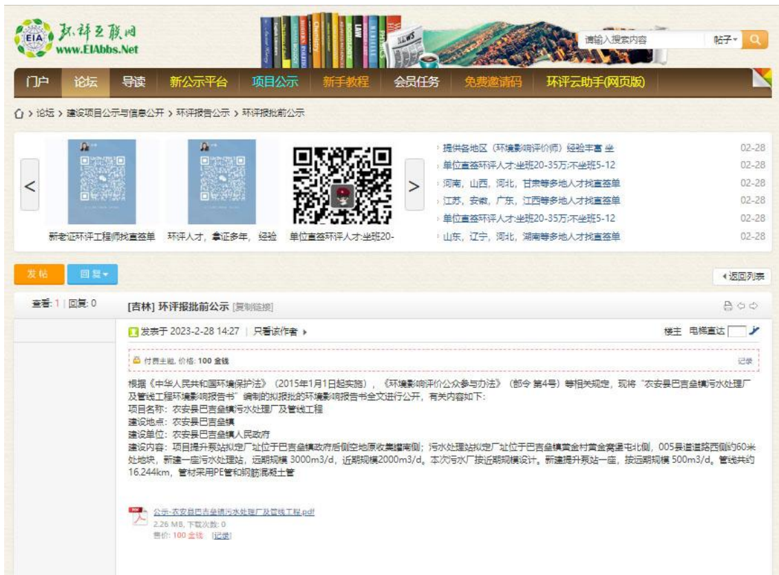
图 2-4 网络公示页面截图