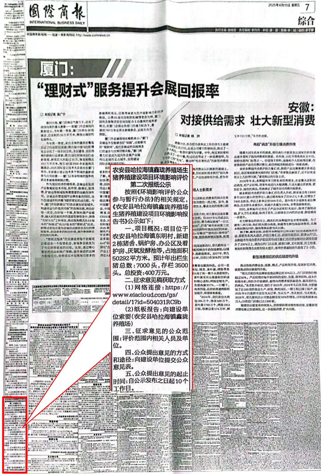
图 3-3 第二次报纸公示