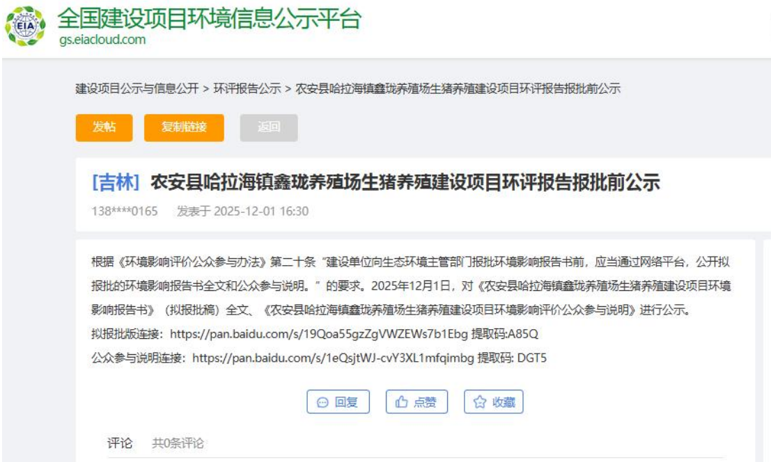
图 6-1 报批前网上公示情况