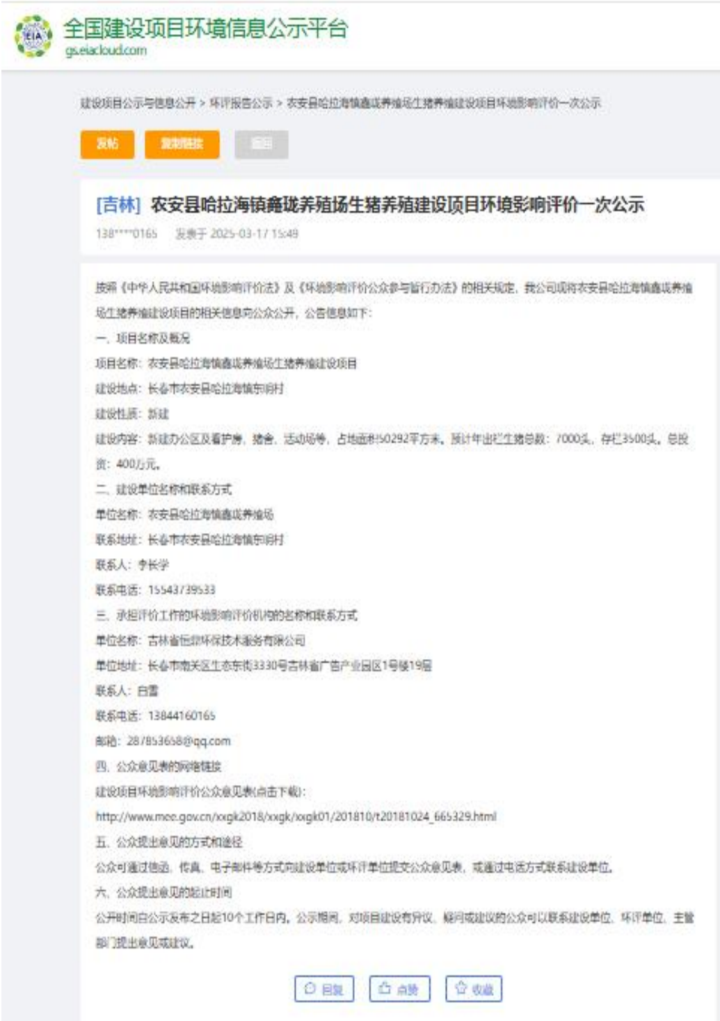
图 2-1 第一次网上公示情况

镇鑫珑养殖场生猪养殖建设项目环境影响评价第一次公示》通过“全国建设项目环境信息公示平台”（ https://www.eiacloud.com/gs/detail/1?id=50317zXxDV ）向社会公布，公示内容中介绍了参与办法中要求的相关事项，符合其网站、建设项目所在地公共媒体网站要求。第一次网上公示情况见图 2-1。