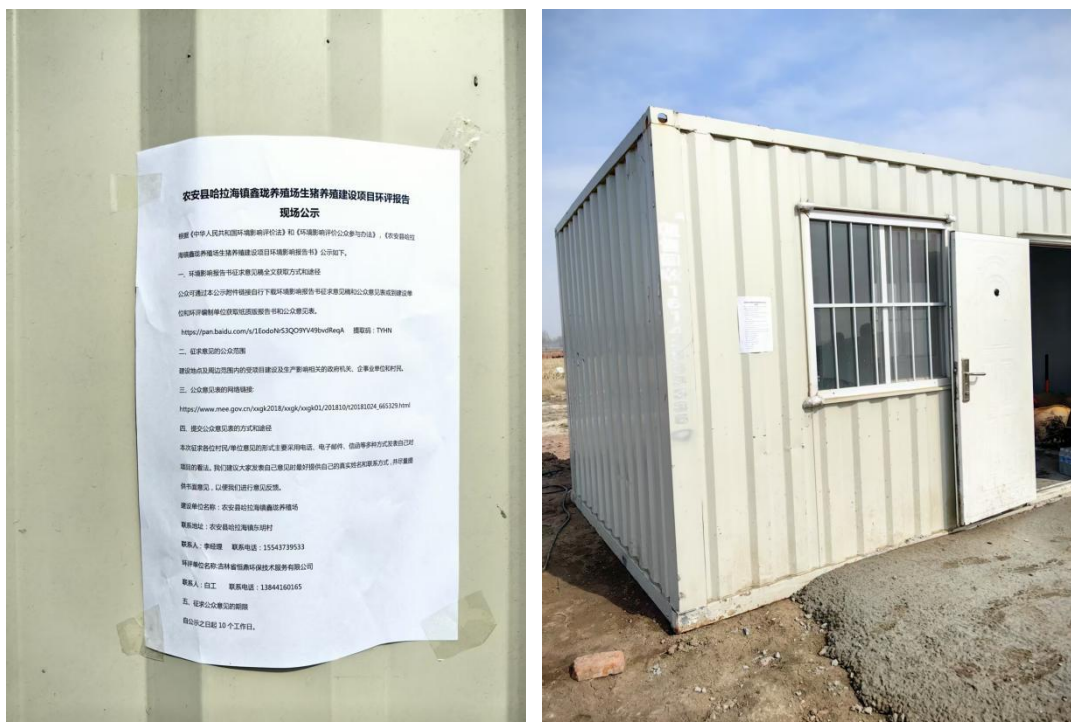
图 3-4 现场公示照片