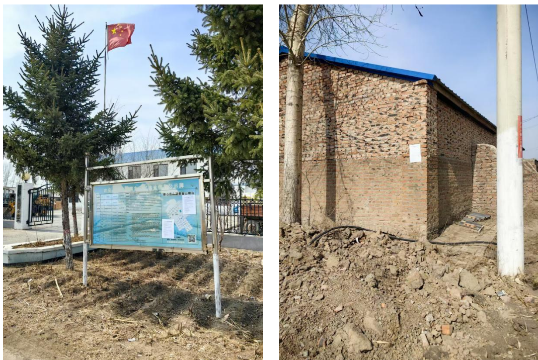
图 3-5 东明村委会及狼洞子屯公示照片