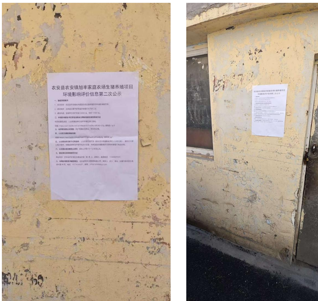
图 3-3 现场照片