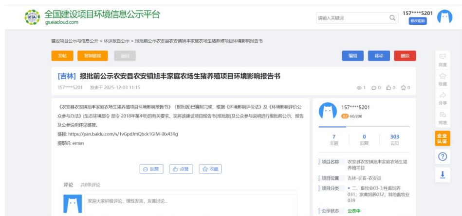
图 6.2-1 网站公示