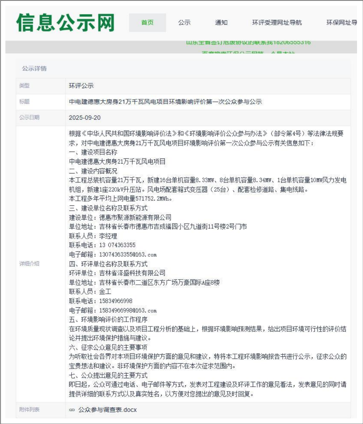
图 2-1 一次网络公示信息截图